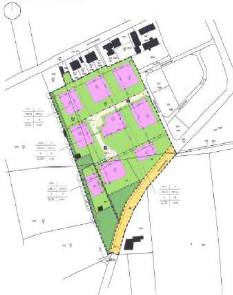
PLANZEICHNUNG - TEIL A