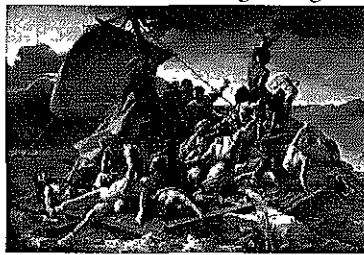
Das Original von Gercault: Das Wrack der Medusa

entspinnen sich Geschichten und Anekdoten rund um die Cranachbilder. Die Entstehungsgeschichte einzelner Werke wird erzählt, Einblick gegeben in das Leben am Hof oder ein Bogen in die Gegenwart geschlagen. Die Spielstätten orientieren sich dabei an Cranachs Alltag und befinden sich z.B. im Cranachhof in der Schlossstraße 1, im Cranachhof im Markt 4, am Rathaus, beim Schloss, in der Stadtkirche, im Lutherhof etc.